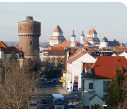
Unsere stadtgeschichtlichen Höhepunkte 2023 ➤ Seite 24