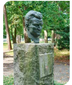
Albert-Kuntz-Denkmal, Wurzen

Dienstag, 1. November 2022, 18.00 Uhr, Kulturhistorisches Museum Wurzen, Kontor | Eintritt frei, um Spende wird gebeten