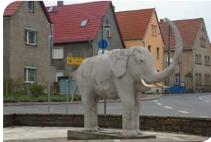
Markantester Streckenpunkt – der alte Kührener Elefant am 10. April 2008.

An dieser Stelle möchte ich einflechten, unterhält man sich mit Kührnern, nicht alle stehen auf der Seite des alten Elefanten, einige sind für das neue Tier mit den zwei Schwänzen – meist Zugezogene. Wenige Meter auf der F 6 gelaufen und dann gleich den Anstieg Bäckenberg hinauf, der dortige Wegpunkt Windmühle ist abgebrochen. Manch einer musste hier schon beißen. Weiter in Richtung Streuben. Hier hatte sich bereits die Spreu vom Weizen