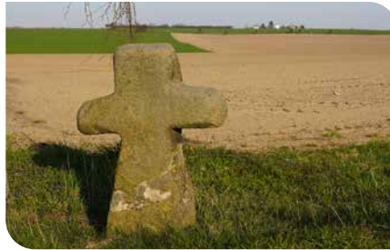
Wer sich am Sühnekreuz umdrehte, sah noch so manchen Läufer an der Turmwindmühle.

getrennt, einige seppelten mit großem Abstand vornweg. Vorbei an der alten Turmwindmühle ohne Fletsche und Schäferei wurde es nun in der Gefällepasse Buchberg runter nach Sachsenendorf richtig flott. Rechtskurve und hinüber Richtung Burkartshain auf der alten Poststraße. Eine elendige Gerade, auf der die Läufer meist den Wind aus Westen von vorn hatten. Wenn man das Steinkreuz (Sühnekreuz, 1839 vor dem Schulgehöft als Hindernis umgesetzt an die Stelle des ehem. Galgens, 1850 wurde es dann an den jetzigen Standort außerhalb des Dorfes versetzt), passiert hatte, sah man bereits die ersten Häuser des Dorfes, die Athleten auf der 10 Kilometer-Distanz zogen ab der Feldscheune das Tempo an. Ab der Schmiede war meist das Rennen entschieden, die letzten Meter auf dem Kopfsteinpflaster bis zum Ziel