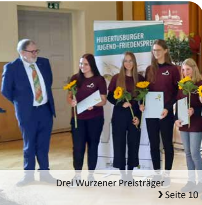
Drei Wurzener Preisträger ➤ Seite 10