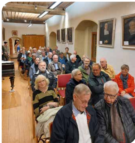
29. September 2022 – Vortragsbesucher