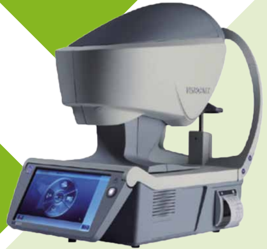
Modernste Messtechnik: der VX 120 von VISIONIX

Wir betrachten Sie aus einem anderen Blickwinkel und beraten Sie optimal, damit Ihnen Ihre neue Brille viel Freude bereitet.