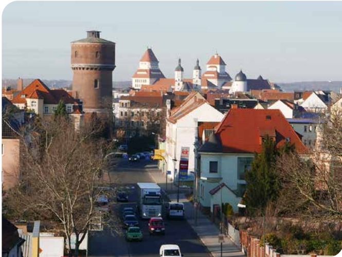
Der Wasserturm, über hundert Jahre ein Symbol unserer Stadt, nun hinter einem Einkaufsmarkt versteckt!