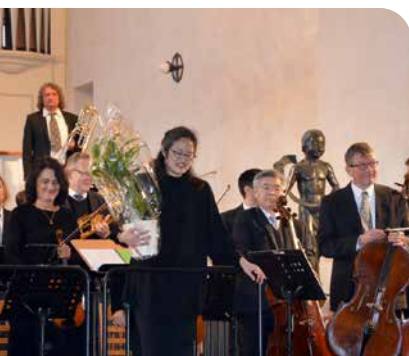
Theodor-Uhlig-Ehrung zum 200. Geburtstag in Wurzen ➤ Seite 34